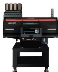
2 3Dプリンターで 印刷