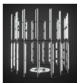
1 3Dスキャナーで 全身を3Dスキャン